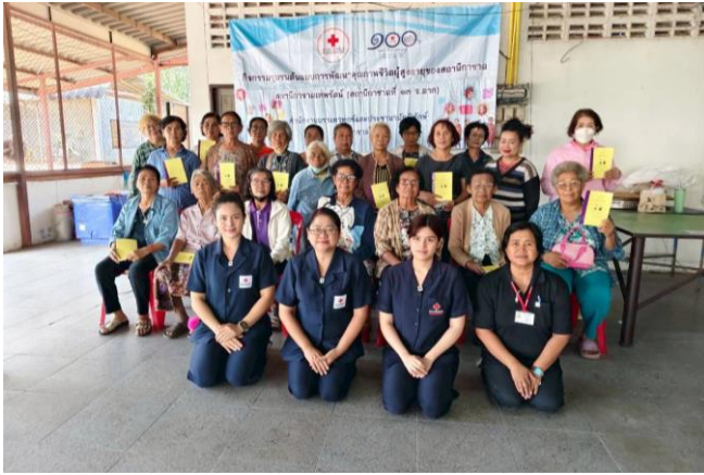
จำนวน ๒๑ คน ณ ศาลาประชาคมหมู่บ้าน บ้านหนองแบน หมู่ที่ ๘ ตำบลหนองบัวเหนือ อำเภอเมืองฯ จังหวัดตาก

วันที่ ๑๖ มกราคม ๒๕๖๙ สถานีกาชาดที่ ๓ เชียงใหม่ ชี้แจงและจัดทำประชาคม “กิจกรรมชุมชนต้นแบบการพัฒนาคุณภาพชีวิตผู้สูงอายุ” ประจำปีงบประมาณ ๒๕๖๙ ในการนี้ ปลัดองค์การบริหารส่วนตำบลสบเปิง ผู้นำชุมชน ผู้สูงอายุและประชาชนในชุมชนบ้านท่าข้าม เข้าร่วมกิจกรรม จำนวน ๕๕ ราย ณ ศาลาการเปรียญ วัดท่าข้าม หมู่ ๖ ตำบลสบเปิง อำเภอแม่แตง จังหวัดเชียงใหม่