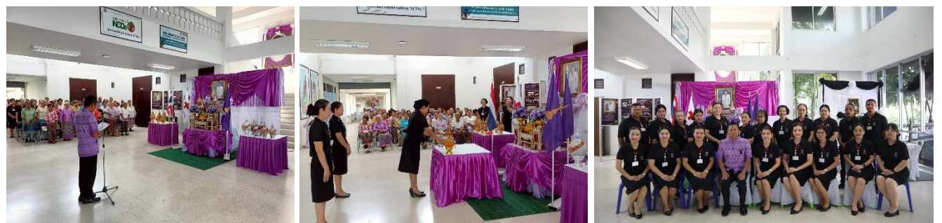
สถานีกาชาดสิรินธร พร้อมด้วยชมรมผู้สูงอายุ ชมรมอาสาสมัครสาธารณสุขประจำหมู่บ้านสถานีกาชาดสิรินธร และประชาชนทั่วไป ร่วมกันจัดกิจกรรมเฉลิมพระเกียรติ เนื่องในโอกาสวันคล้ายวันพระราชสมภพ สมเด็จพระกนิษฐาธิราชเจ้า กรมสมเด็จพระเทพรัตนราชสุดาฯ สยามบรมราชกุมารี อุปนายกผู้อำนวยการสภากาชาดไทย วันที่ ๒ เมษายน ๒๕๖๙