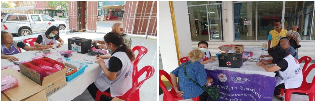
ให้บริการตรวจสุขภาพเชิงรุกแก่ประชาชนที่มาร่วมกิจกรรม ได้แก่ คัดกรองโรคความดันโลหิตสูง คัดกรองโรคตา ให้คำแนะนำเรื่องสุขภาพ และมอบเครื่องอุปโภค บริโภค แก่กลุ่มเปราะบาง ผู้ยากไร้ ผู้สูงอายุและประชาชน ในบริเวณพื้นที่เขตภาษีเจริญ