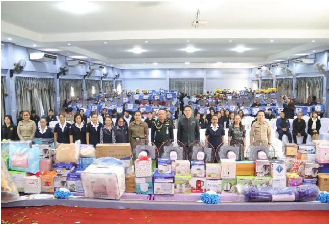
จำนวน ๒๐๐ ผืน ให้กับผู้พิการเพื่อบรรเทาภัยหนาว ตามการร้องขอรับการสนับสนุนทางแอปพลิเคชัน “พินภัย”

วันที่ ๑๒ มกราคม ๒๕๖๙ สถานีกาชาดเทพรัตน (สถานีกาชาดที่ ๑๓ จังหวัดตาก) ร่วมงานวันคนพิการสากลจังหวัดตาก ประจำปี ๒๕๖๘ ณ โรงเรียนโสตศึกษาจังหวัดตาก ตำบลปามะม่วง อำเภอเมืองฯ จังหวัดตาก โดยมีรองผู้ว่าราชการจังหวัดตาก เป็นประธานในพิธี พร้อมด้วยนายกเหล่ากาชาดจังหวัดตาก พัฒนาสังคมและความมั่นคงของมนุษย์จังหวัดตาก หัวหน้าส่วนราชการ คณะกรรมการ/สมาชิกเหล่ากาชาดจังหวัดตาก ผู้ดูแลผู้พิการและผู้พิการจากอำเภอต่าง ๆ ในจังหวัดตาก เข้าร่วมงาน โดยสถานีกาชาดเทพรัตน มอบผ้าห่ม