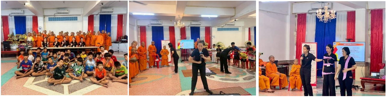
จัดกิจกรรมอบรมการปฐมพยาบาลเบื้องต้น เฉลิมพระเกียรติสมเด็จพระกนิษฐาธิราชเจ้า กรมสมเด็จพระเทพรัตนราชสุดาฯ สยามบรมราชกุมารี เนื่องในวันคล้ายวันพระราชสมภพ ๒ เมษายน ๒๕๖๙